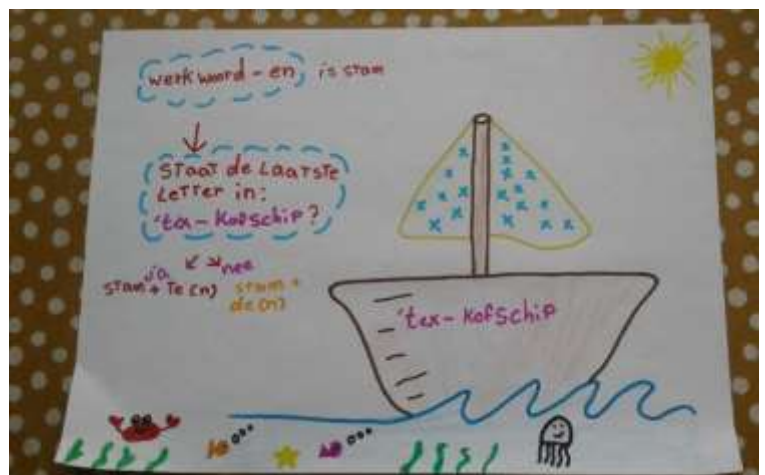
Tekening 't ex kofschip (Bovenbouw)