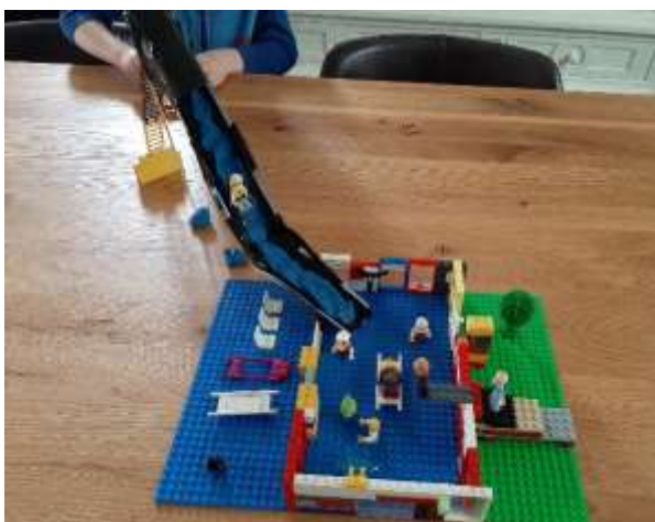
Thema zwembad – Lego (Onderbouw)