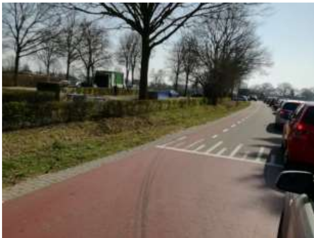
De auto's stonden op de Speulhofsbaan in de file.